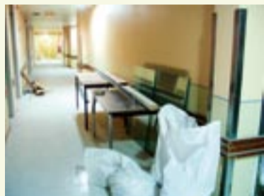
Des travaux importants.