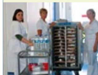
Avant de mettre le chariot en chauffe, vérifier les joints...