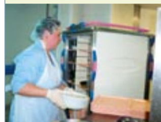
Tout commence et finit à la cuisine.