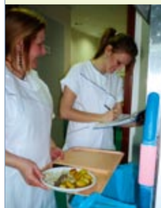
Le débarrassage du repas est l'occasion de surveiller l'alimentation du patient.