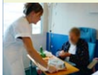
Présenter le plateau en incitant le patient à manger !