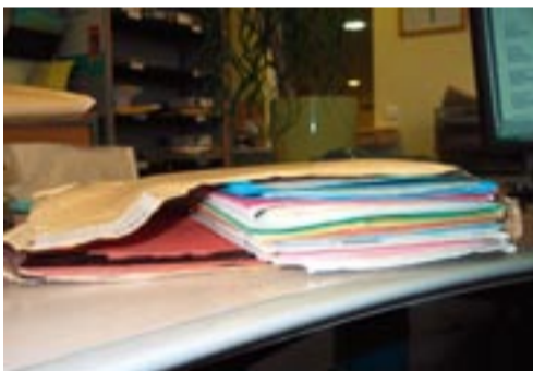
Exemple d'indicateur qualité : la tenue du dossier patient en Pneumologie.

Avec ces indicateurs, la HAS veut fournir aux établissements de santé des outils et méthodes de pilotage